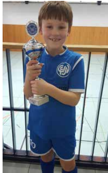
2. Platz beim SSC Hagen Ahrensburg

gegeneinander an. In diesem Turnier wurden in einem – wie wir finden – tollen Spielmodus in drei Ligen gleich dreimal Erst-, Zweit- und Drittplatzierte ausgespielt, nämlich die Sieger jeweils der Champions League, der Europa League und des Challenge Cups. Am Ende gibt es daher keine „schlechten“ hinteren Ränge; stattdessen haben auch diejenigen, die nicht so gut durch die Gruppenspiele gekommen sind, noch die Chance auf einen Pokal in ihrer jeweiligen Liga. Wir konnten uns letztlich im Challenge Cup einen 2. Platz erspielen. Fazit: Ein tolles langes Wochenende! Bemängelt wurde lediglich, dass es so kurz war. Aber das lässt sich ja nächstes Jahr leicht besser machen! Jetzt aber freuen uns erst einmal auf die noch ausstehenden Punktspiele und auf unser Abschlussturnier Anfang Juli beim SC Buntekuh in Lübeck.