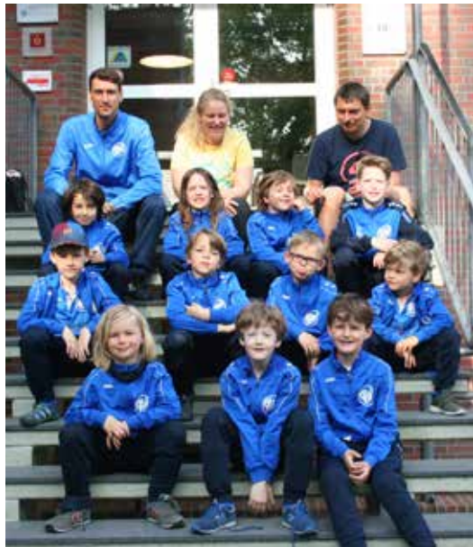
Die Mannschaft vor der Jugendherberge in Aurich

Spieltagen erzielten wir 4 Siege und eine fantastische Tordifferenz von 47:1. Wir hatten die 2.F nach einer sehr durchwachsenen Vorsaison zunächst schwach gemeldet, was sich im Nachhinein nicht als die richtige Einordnung erwies. In der Hallensaison trafen wir dann auf deutlich stärkere Mannschaften und der Höhenflug wurde erst einmal ein bisschen gebremst, denn hier wurde nun auch häufiger unentschieden gespielt. Dabei ging aber nur ein Spiel (von über 20) verloren. Der krönende Abschluss der Hallensaison war ein toller 2. Platz bei einem stark gemeldeten Hallenturnier beim SSC Hagen Ahrensburg: Hier konnten wir uns gegen diverse 1. Mannschaften, insbesondere der Uhlenhorster Adler, durchsetzen und mussten uns nur im Finale einer starken Mannschaft des Ratzeburger SC geschlagen geben. Stolz brachten