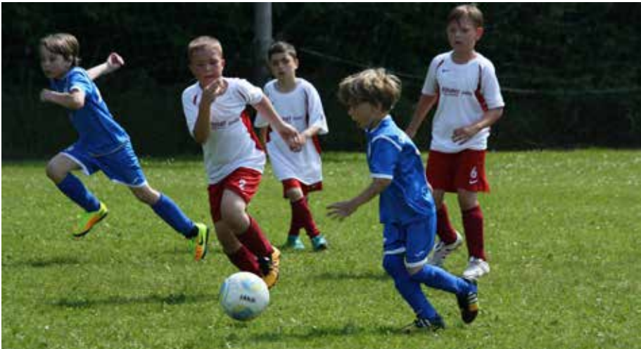
Unsere Stürmer beim Weert Ihnen Cup auf Kurs

Wie auch letztes Jahr war das gemeinsame Trainingslager für die Kinder das Highlight der Saison: Dieses Mal ging es über das Himmelfahrtswochenende für drei Tage ins schöne Aurich. Die sportzertifizierte Jugendherberge des DJH lag direkt an dem tollen Kunstrasenplatz der Sportvereinigung Aurich von 1911, perfekte Trainingsbedingungen für uns! Zum Abschluss unserer Ausfahrt nahmen wir sonntags am Weert-Ihnen-Cup teil, ein großes, mehrtägiges Jugendturnier, das der Blau-Weiss Borssum, Emden, jedes Jahr ausrichtet. Allein in der F-Jugend traten fast 30 Mannschaften