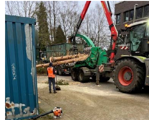
Umbauten auf der Wilhelmshöh